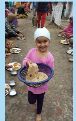
I am also here with you