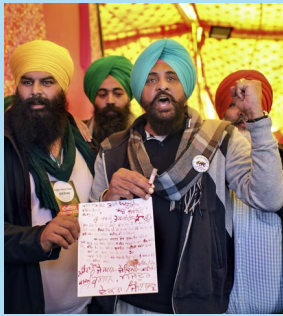
Letter written by blood sent to PM Narendra Modi