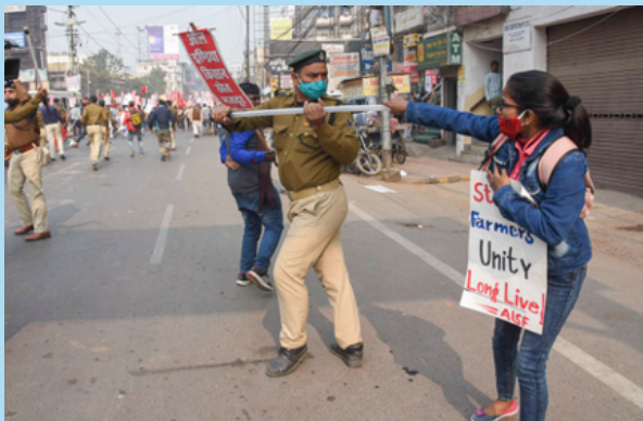
Police attacking the peaceful marchers