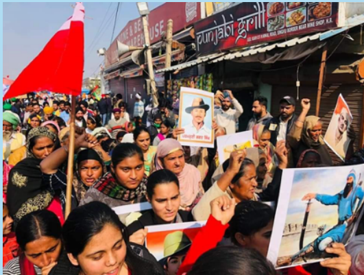
No to new farm law