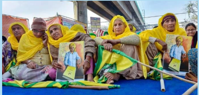
We shall overcome