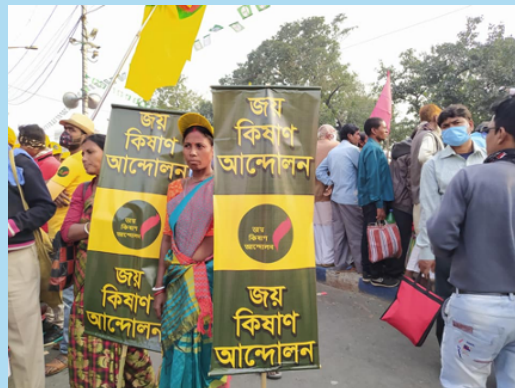
Protest rally in support of the farmers